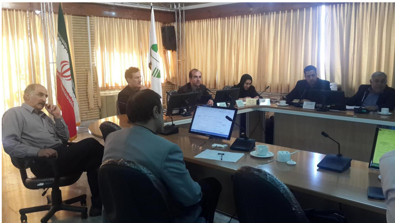
شکل ۳-۳- نشست هم‌اندیشی بخش کشاورزی و امنیت غذایی کشور، سالن سرو، سازمان حفاظت محیط زیست