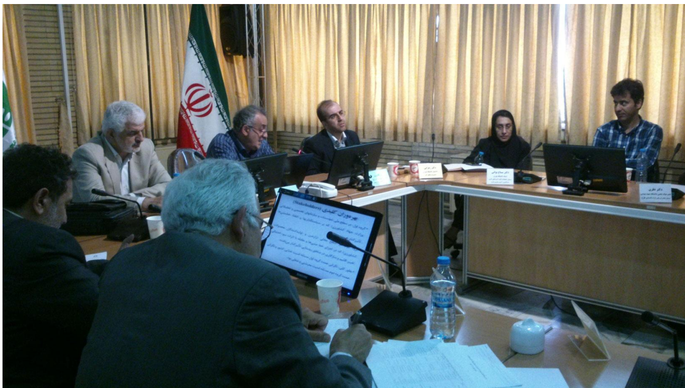
شکل ۳-۱- نشست هم‌اندیشی بخش کشاورزی و امنیت غذایی کشور، سالن سرو، سازمان حفاظت محیط زیست