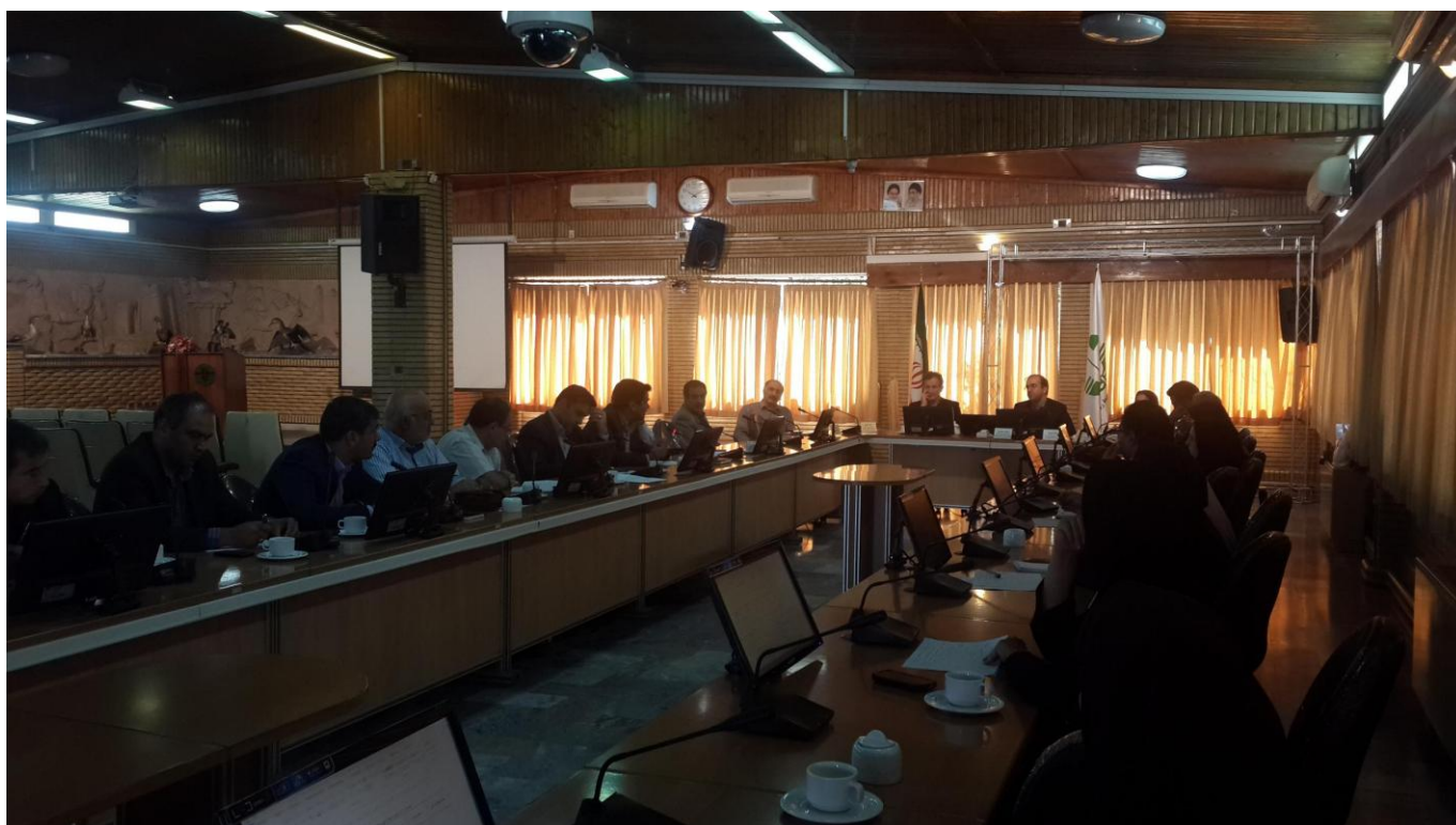
شکل ۳-۴- نشست هم‌اندیشی بخش کشاورزی و امنیت غذایی کشور، سالن سرو، سازمان حفاظت محیط زیست