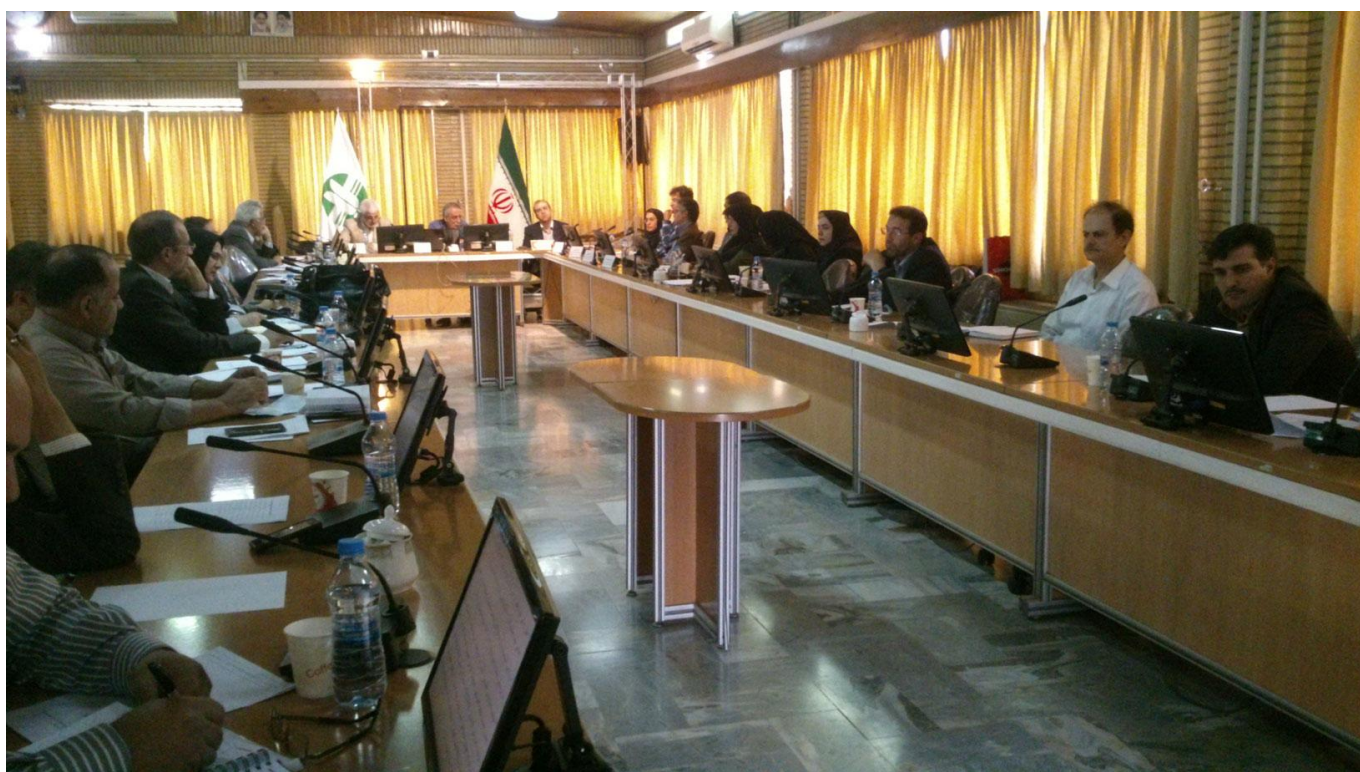
شکل ۳-۲- نشست هم‌اندیشی بخش کشاورزی و امنیت غذایی کشور، سالن سرو، سازمان حفاظت محیط زیست